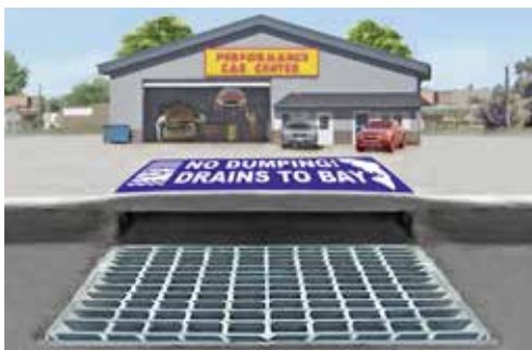
Alcantarilla: una alcantarilla externa que desemboca directamente en los arroyos y la Bahía.

Si su negocio cuenta con desagües de piso, comuníquese con la agencia de tratamiento de aguas residuales de su localidad a fin de informarse sobre los requisitos para desechar líquidos en el sistema de desagüe cloacal.