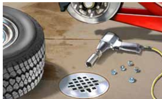
Sistema de drenaje de residuos sanitarios: un desagüe interno que desemboca en la planta de tratamiento de aguas residuales.